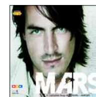
CD Mars "Reason" (DEAG) www.deag.de