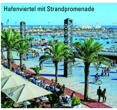
Hafenviertel mit Strandpromenade

www.barcelona.org www.gaybarcelona.net www.barcelonagay.com www.barcelonaturisme.cat www.TomOnTour.de