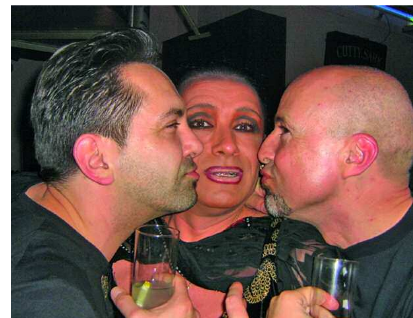
Bussi-Gesellschaft im Atame

Das "Z:eltas" ist der Treff junger Trendsetter. Doch auch jenseits der 40 fühlt man sich wohl in der geschmackvollen Cocktailounge, in der sich die Schönen und Wilden für den späteren Disco-Trip eintanzen. Der Danceclub, der jeden Tag sei-