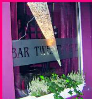
Bar Twenty One

zu erhalten. Dass die Gayszene Antwerpens den EuroGames entgegen fiebert, zeigen die zahlreichen Voranmeldungen einheimischer SportlerInnen. 500 schwul-lesbische Teilnehmer aus der Stadt wollen an den EuroGames teilnehmen.