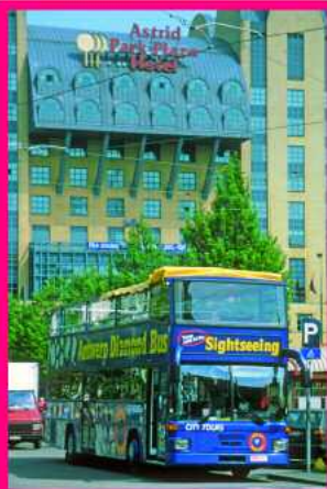
Astrid Park Plaza