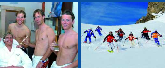
Das Team der Alpentherme Gastein