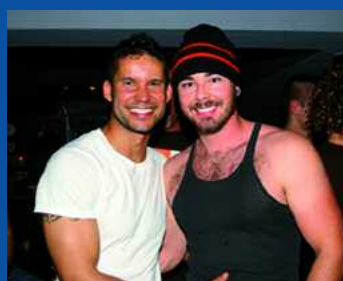
Winter Pride in Whistler Mountain