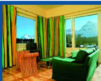
Lifestyle-Zimmer im Hotel Eden