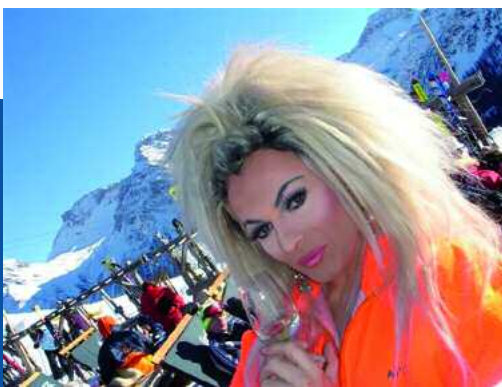
Drag Queen Race in Arosa

und 750 im "Seehof Arosa" zu entrichten. Den Eventpass gibt es in Gold (260 CHF), Silber (135 CHF) und Bronze (75 CHF). Wer das gesamte Programm erleben will, darf sich auf ein Welcome-Abendessen im "Hotel Eden", einen Wellnessstag im "Tschuggen Grand Hotel", vor allem aber auf einen romantischen Ausflug zur Tschuggenhütte mit Käsefondue und Kerzenlicht freuen sowie auf eine Schaumparty im "Kitchen Club".