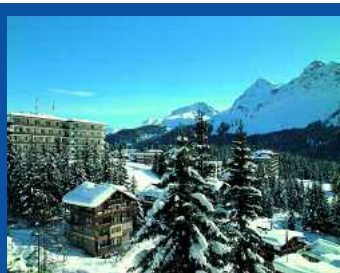
Hotel Eden in Arosa

Das Hotel "Eden Arosa" ist die Homebase der Veranstaltung. Das 80-Betten-Haus war früher ein Sanatorium und wurde nun in ein attraktives Lifestyle-Hotel verwandelt. 1.080 Schweizer Franken kostet das Arrangement für den schwulen Skifahrer. 1.605 sind im "Tschuggen Grand Hotel"