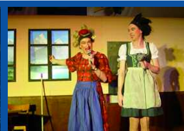
Party-Spaß in Zell am Ziller mit den „Kutschallas“